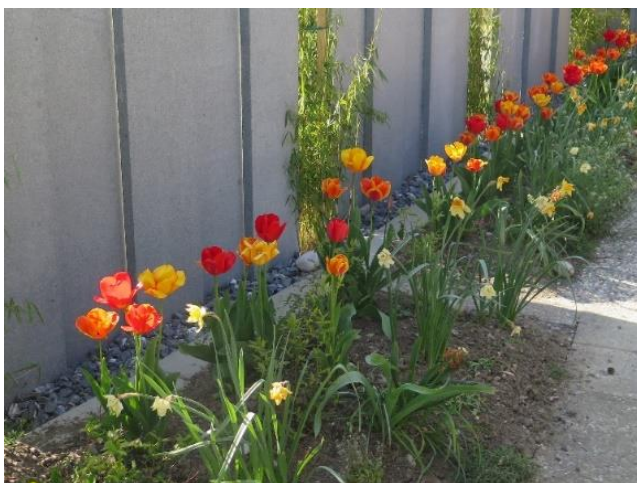
Blumen – Boten des Frühlings

Jin Shin Jyutsu – Ström Tipp Der 1er Strom – für einen Aufbruch Herbert Schrepfer