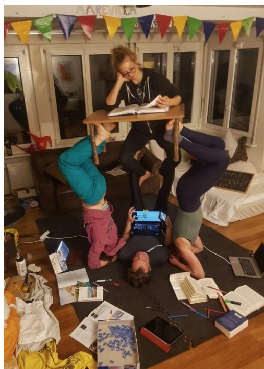
Foto: WG Aarevilla Kunterbunt Schöpferkraft und Kreativität weiter - und nicht zuletzt Humor. Diesen zeigt das Bild aus einer WG in Bern zum Thema «home office und Zusammenleben bringt fun!»

Mit dem Strömtipp legen wir den Fokus nochmals auf die Stärkung des Immunsystems. Wir sind gut beraten die neue (noch isolierte Form) des Zusammenlebens weiterhin zu üben. Hier helfen uns die in jedem Menschen innewohnende