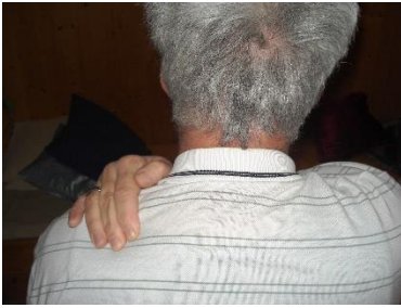
SES 3 Für das Immunsystem