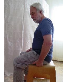
SES 25 Für innere Ruhe und Kraft

Wir achten während des Strömens bewusst auf unsere Atmung, im gleichen Sinn wie bei der Grossen Umarmung. Die grosse Umarmung kann als Einstimmung immer jedem Strömstipp noch vorangestellt werden.