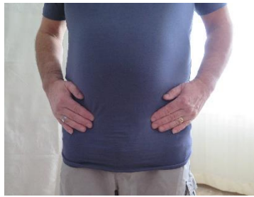
SES 15 Für Freude und Lachen im Herzen