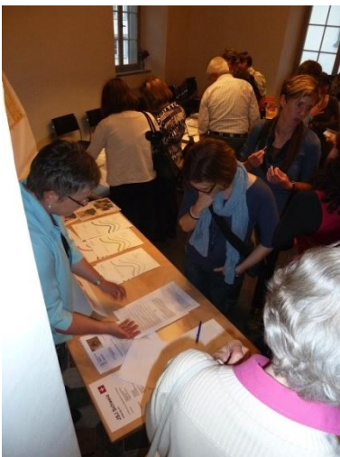
Informationsaustausch und Büchermarkt